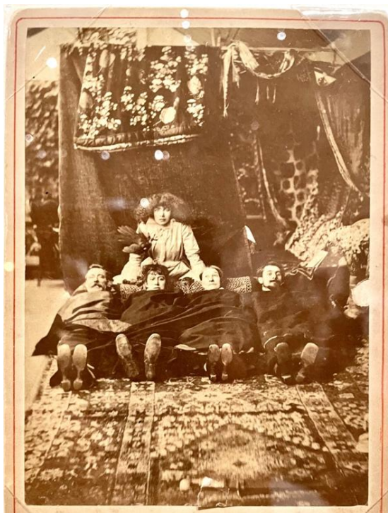
Sarah Bernhardt, Tableau vivant de ses amis