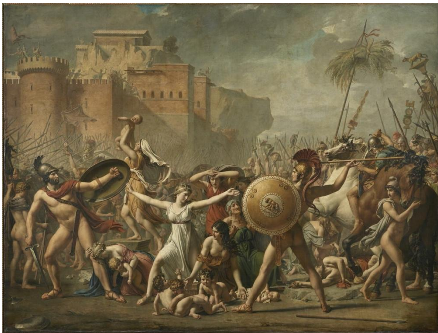
Jacques-Louis David (1748-1825) L'Enlèvement des Sabines , 1796-1799, Louvre

L'auteur donne ses consignes, sans doute d'après une gravure car il inverse toutes les poses ...