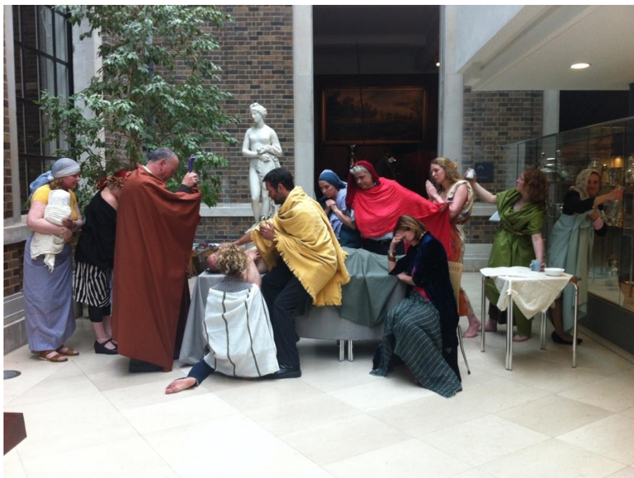
Fitzwilliam Museum 2012 : l'équipe du musée simule un tableau de ses collections : L'Extrême-onction de Poussin

Et, en 2014, Robert Wilson (né en 1941) s'y applique avec la vidéo, mais là, littéralement, créant un « tableau vivant », puisque Lady Gaga est son modèle : il offre là une curieuse inversion de sexe du personnage et lui fait réciter indistinctement un extrait des Malheurs de Justine de Sade. Il la figura également en Mademoiselle Rivière d'Ingres et en tête coupée de Saint Jean-Baptiste , d'après Andrea Solari, clignant des yeux dans ces deux tableaux hyperréalistes.