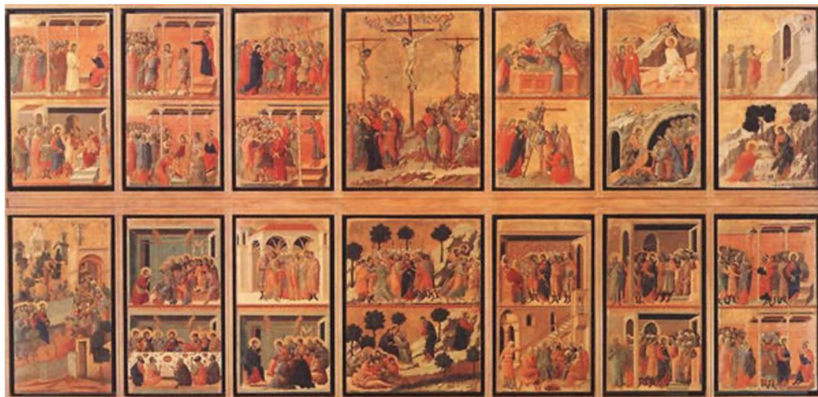
La Maestà , prédelle de Duccio (1308-1311 ; Museo del'Opera del Duomo, Sienne).

un tableau d'autel, en général un Christ ou une Vierge en majesté, d'où le nom de Maestà ; elle était constituée d'un certain nombre de petits tableaux représentant des scènes de la vie du Christ, ou d'un saint.