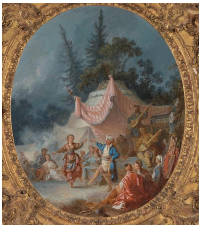
Jean-Baptiste Le Prince (1734-1781) La Danse Russe

En 1759 aussi, Noverre, maître de ballet et danseur lui-même, écrivait dans ses Lettres sur la danse et sur les ballets : « ... un ballet est un tableau, la scène est une toile ». Et en 1783, Grimm, à propos de La Caravane du Caire de Morel et Grétry estima que « c'est un vrai tableau dans la manière de Le Prince » (peintre familier des costumes exotiques orientaux).