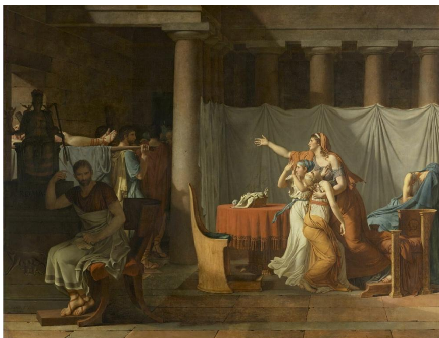
Jacques-Louis David (1748-1825) Les lecteurs rapportent à Brutus les corps de ses fils, 1789, Louvre

reprise de Voltaire (qui l'avait écrite en 1730, en Angleterre), reforma sur scène avec grand succès le fameux tableau de David qui venait d'être présenté au Salon de 1789 (et le sera encore en 1791) : le thème en est crucial, du choix qu'un père dut faire entre son devoir de citoyen – son parti pris – et celui de père de famille, qu'il renie, et laissa aux femmes le désespoir filial ...