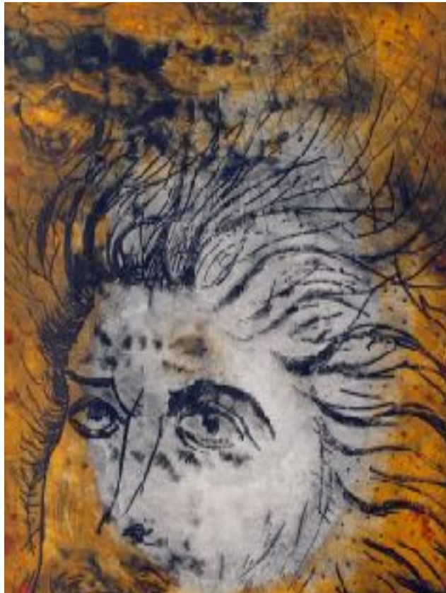
Le messager du feu