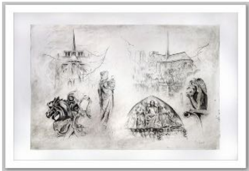
Notre Dame de Paris