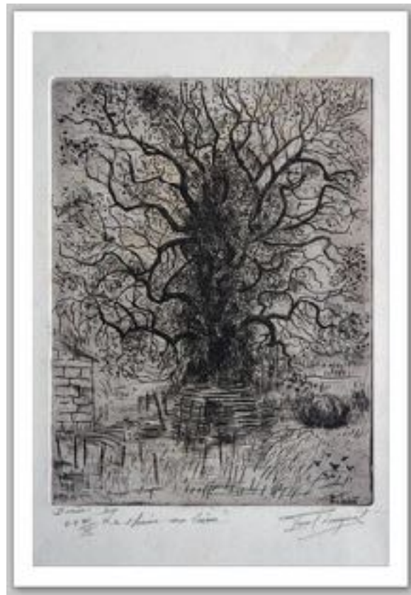
Le chêne au lierre

Suivent des « Images de la Nature », un magnifique ouvrage de 18 burins et textes originaux, dédié par René Huyghe, de l'Académie Française, conservateur en chef du Musée du Louvre.