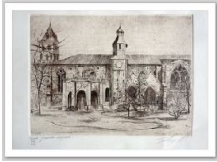
Église Saint Seurin Bordeaux