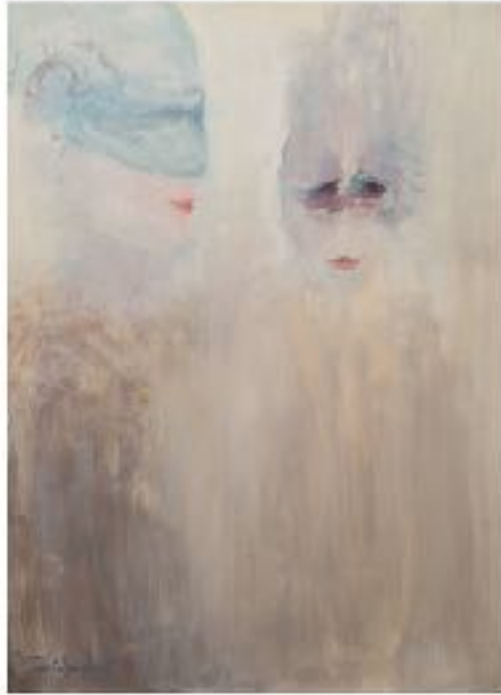
Les Ombres de Venise 2011