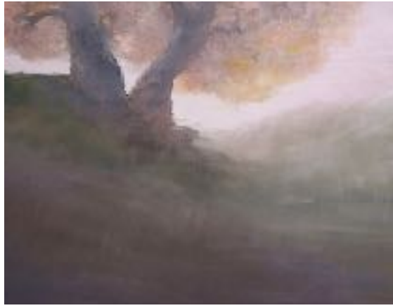
Les Hauts de Hurlevent 2016