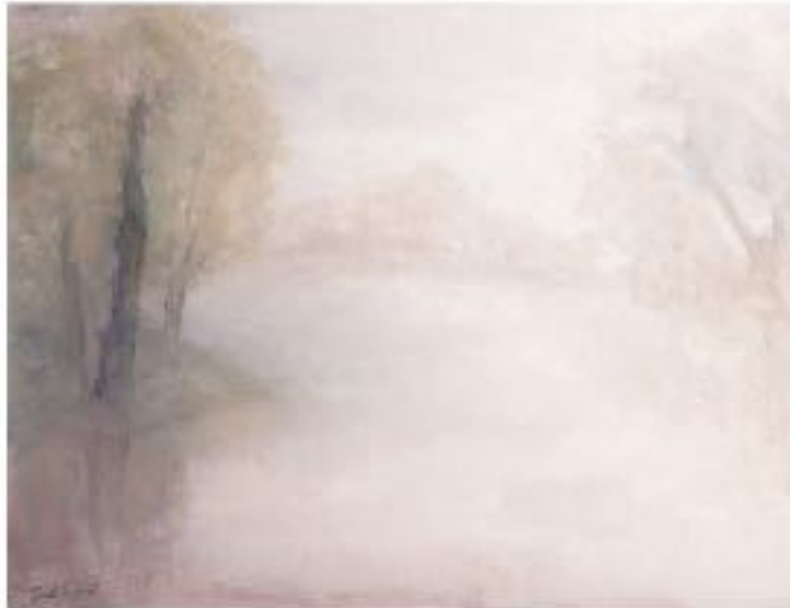
Printemps au bord de l'eau 2016